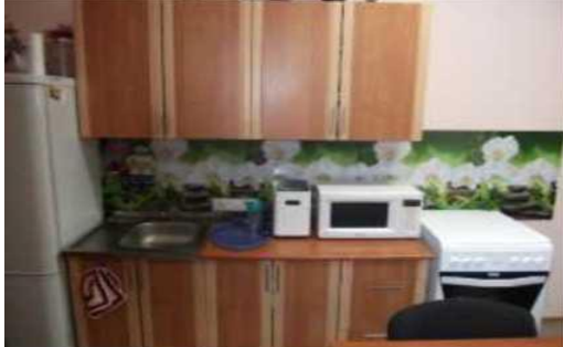
комната оккупациональной терапии с элементами тренировочной квартиры