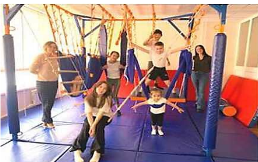
сенсорно-динамический зал «Дом Совы»