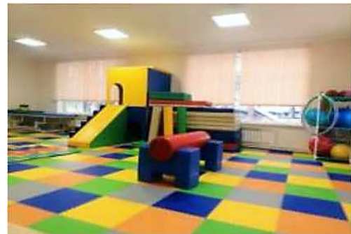
зал лечебной физкультуры