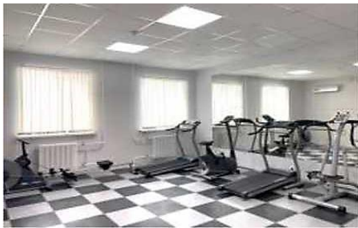
зал лечебной физкультуры